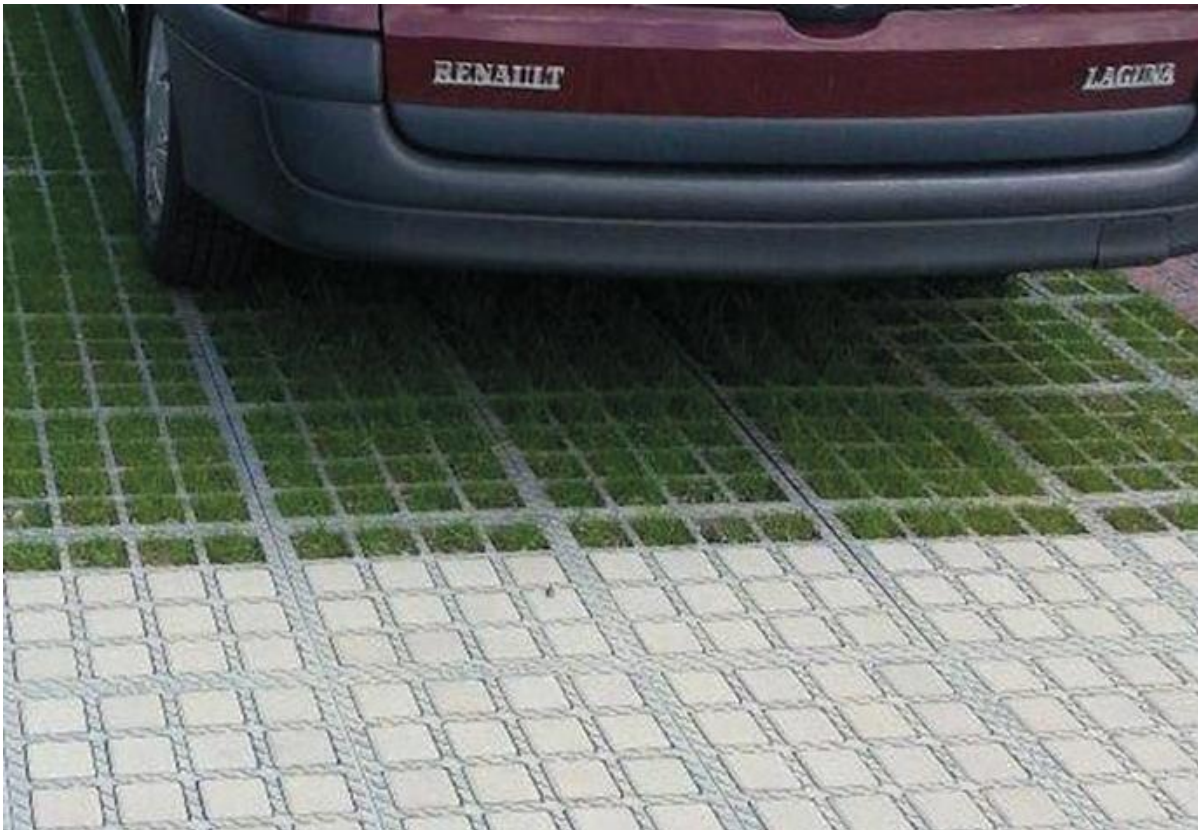
Abbildung 5: Beispiel MultiDrain-PLUS 2000 System

Durch die geplante Straßenbaumaßnahme werden auf beiden Straßenseiten insgesamt 270 Parkstände entstehen. Im Vergleich zum Bestand von 274 Parkständen entfallen 4 Parkstände. Die Parkplätze werden nicht markiert. Um einen weiteren vollwertigen Parkstand generieren zu können, muss auf der Nordseite gegenüber der Hausnummer 64 eine vorhandene E-Ladesäule, um ca. 1,30 m in Richtung Westen, versetzt werden. Darüber hinaus entfällt der vorh. Parkstreifen mit 6 Parkständen auf der Ostseite der Fuhlsbüttler Straße zwischen ca. Hausnummer 5 und der Einmündung Struckholt. Grund hierfür ist die Verbreiterung des vorh. Radweges, zuzüglich eines Sicherheitstrennstreifens zur Fahrbahn und neue taktile Platten zum Gehweg.