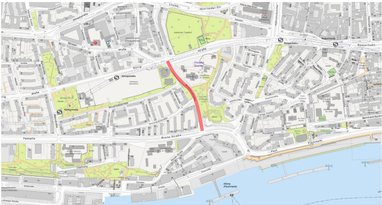
Abbildung 1: Übersichtsplan Kirchenstraße

Die Kirchenstraße ist Bestandteil der Veloroute 12 und soll zur Förderung des Radverkehrs optimiert werden. Um den Anforderungen einer Fahrradstraße gerecht zu werden, ist es erforderlich, dass die Fahrbahndecke instandgesetzt wird, worüber Wir Sie hiermit informieren.