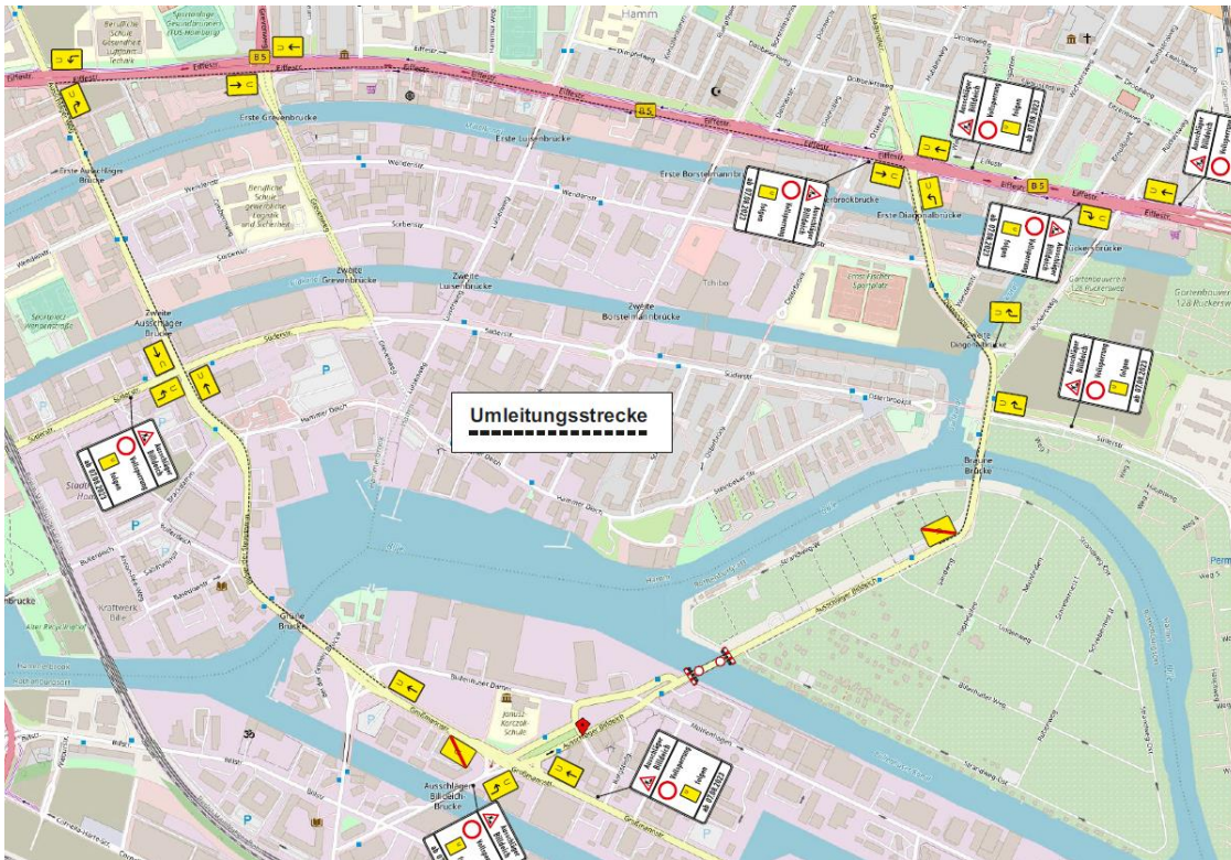
Abbildung 2: Umleitungsstrecke Ausschläger Billdeich

Der Bus 130 fährt für die Bauzeit eine Umleitung.