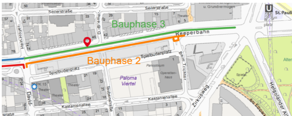
Bauphase 2 und 3