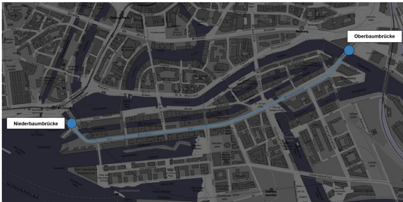
Abbildung 1: Planungsbereich Am Sandtorkai-Brooktorkai (Niederbaumbrücke - Oberbaumbrücke)

Die Straßen Am Sandtorkai und Brooktorkai liegen im Bezirk Hamburg-Mitte im Stadtteil Hafencity. Der Straßenzug stellt, neben der Hafencity als bedeutende Quell- und Zielzelle, eine wichtige Verbindungsfunktion zwischen Innenstadt/Altona und dem Hamburger Osten dar.