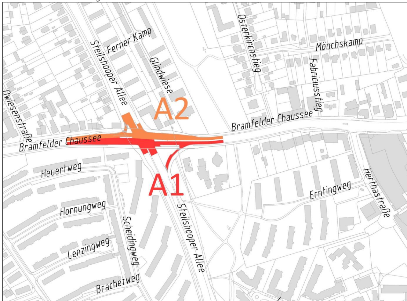
Abbildung FHH Atlas

Der Kreuzungsbereich Bramfelder Chaussee / Steilshooper Allee wird in zwei Teilabschnitten wie folgt saniert: