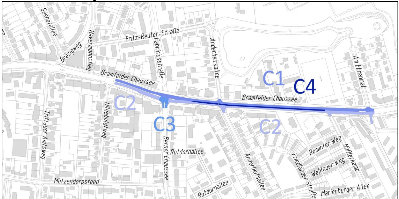
Abbildung FHH Atlas

Die Bramfelder Chaussee von Hildeboldtweg bis Königsberger Straße wird in vier Teilabschnitten wie folgt saniert: