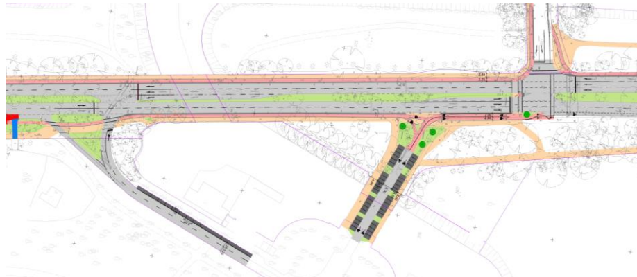
Abbildung 3 - Südring

Die Verkehrsführung am Südring wurde überprüft und ein Entwurf entwickelt bei dem der südliche Zugang dem Radverkehr zugeschlagen wird und der MIV ausschließlich über den nördlichen Ast des Südrings erfolgen sollte. Dies wurde jedoch aufgrund Überlegung seitens des Bezirks über die weitere Entwicklung des Südrings nicht weiter verfolgt.