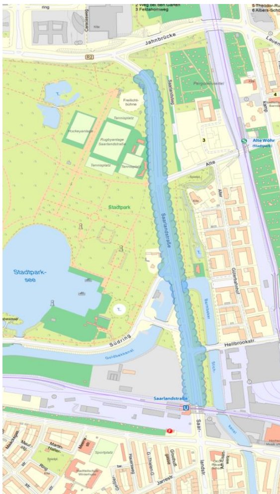
Abbildung 1-1 Lage der Saarlandstraße

Gegenstand der 1. Verschickung ist die Teilbaumaßnahme „Sanierung & Umgestaltung Saarlandstraße im Bereich Jahning bis U-Bahn Saarlandstraße“.