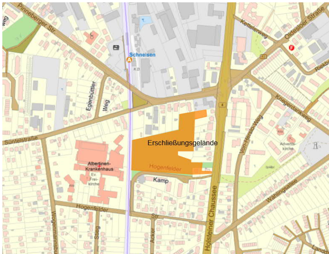
Abbildung 1: Lage des Erschließungsgeländes und Abbild des bestehenden Straßenverkehrsnetzes

Der Hogenfelder Kamp ist eine Erschließungsstraße (Tempo-30-Zone), die über die südwestlich anschließende bügelartige Hogenfelder Straße vorfahrtgeregelt an die Holsteiner Chaussee anknüpft. Der Hogenfelder Kamp endet heute in einer Wendeanlage, an der wiederum eine fußläufige Wegeverbindung zur Holsteiner Chaussee anschließt. Auf gleicher Höhe dieser Wegeverbindung schließt östlich der Holsteiner Chaussee ein Grünzug mit einer weiteren Fuß- und Radwegeverbindung in Richtung Von-Herslo-Weg und Kriegerdankweg / Wählingsallee an.